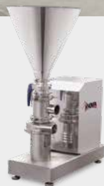
Miscelatore solido-liquido Mélangeur poudre-liquide