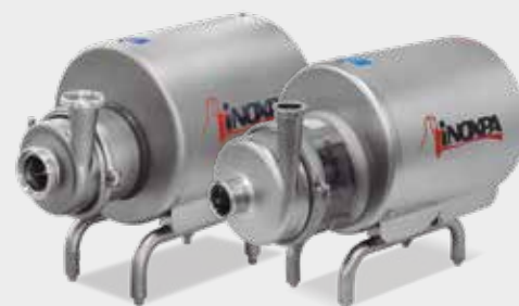
Pompe centrifughe Hyginox, Prolac Pompes centrifuges Hyginox, Prolac