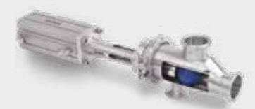
Sistema PIG di recupero di prodotto Système de raclage PIG