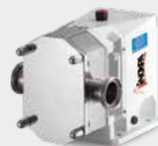
Pompa a lobi SLR Pompe rotative à lobes SLR