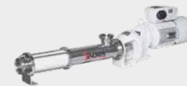
Pompa monovite elicoidale Kiber Pompe à vis hélicoïdale, Kiber