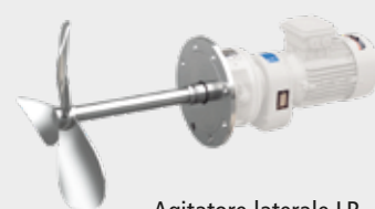
Agitatore laterale LR Agitateur latéral LR