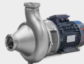
Pompa a girante elicoidale RV Pompe à Turbine Hélicoïdale, RV