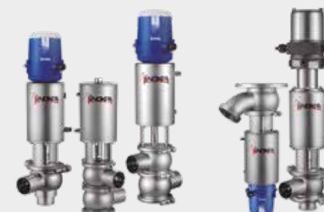
Valvole a sed Vannes à clapet