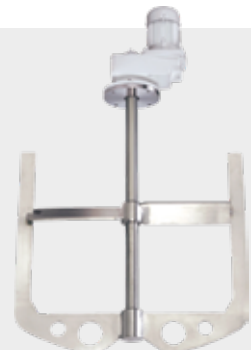
AGC agitador con áncora AGC agitator with anchor

The extensive range of settings means production can be optimised, maximising the yield from each ingredient and obtaining the highest possible energy efficiency. Production costs drop significantly as a result.