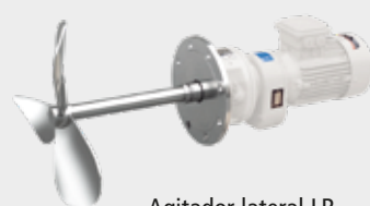
Agitador lateral LR LR side-entry agitator