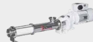
Bomba de tornillo helicoidal: Kiber Progressive cavity pump: Kiber