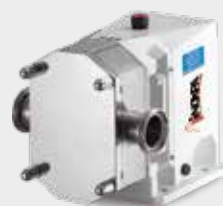
Bomba lobular rotativa: SLR Rotary lobe pump: SLR