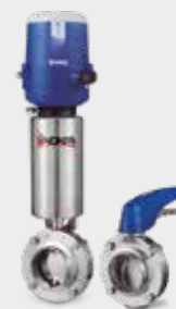
Válvulas de mariposa manuales o neumáticas Manually or pneumatically actuated butterfly valves